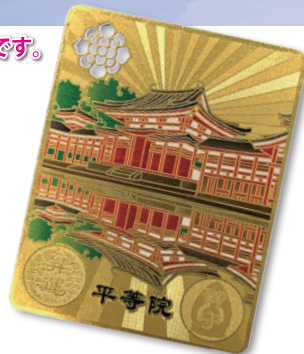
(↑サンプルとしてお作りしたものです。)