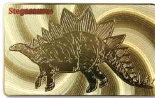
(↑単色印刷もございます。)