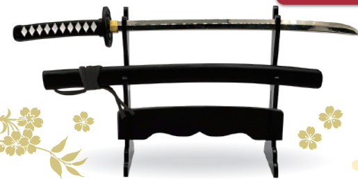
サイズ=本体全長183mm、鞘入り全長200mm