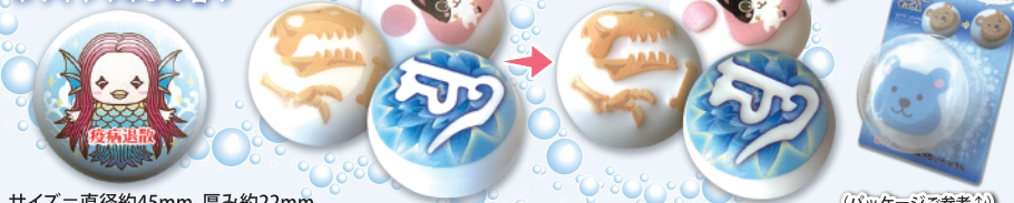
サイズ=直径約45mm 厚み約22mm

この石けんは、薬事法上の化粧石鹸ではなく、「雑貨品」です。化粧品・医薬品・医薬部外品のいずれにも該当しません。絵柄は水を弾きますが、強くこすると印刷が取れる場合がございます。また、使用していくうちに、徐々に印刷が剥がれ、細かい印刷くすが出ますが、よく洗い流してください。常に濡れた状態で長時間放置されたり、エアコンが当たる様な乾燥状態に長時間おくと、剥がれやすくなることがあります。日本製化粧石鹸使用。成分:石ケン素地、水、グリセリン、塩化Na、エチドロン酸4Na、EDTA-4Na、PEG-75、香料、酸化チタン