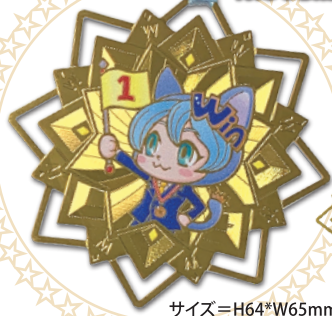
サイズ=H64*W65mm(プレート部分)

特殊な模様が入ったエッチング加工のしおり、カードです。美術品やキャラクター等のグッズにおすすめです。