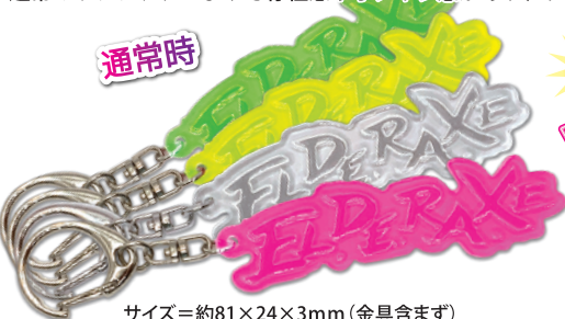
サイズ=約81×24×3mm(金具含まず)