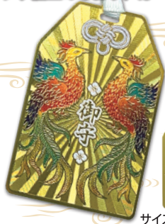
サイズ=62*41mm(プレート部分)